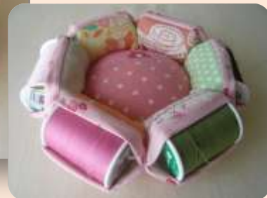
デザイン・制作： D&amp;L MemE／ふくたまこ

イラストは、 D&L MemE ハンドメイドぬりえ【B5002】 p1「ハンドメイド大好き」まや